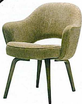
Finne mit Holzbein DEN SKANDINAVISCHEN STUHL GIBT ES MIT HOLZBEINEN NEU IM LADEN, MIT LACKIERTEN STAHLROHRBEINEN NUR NOCH VINTAGE „71“, Knoll International, ab 1.630 Euro