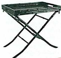
Astrein DAS SPANISCHE MODEIMPERIUM ZARA STELLT AUCH PREISGÜNSTIGE MÖBEL HER, WIE DIESER BAMBUS-TISCH BEWEIST „Tablett Markus“, Zara Home, 90 Euro