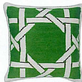
Gutes Handwerk DIE KISSEN WERDEN IM RAHMEN EINES KÜNSTLER-HILFSPROGRAMMS IN PERU VON HAND GEFERTIGT „Southampton“, Jonathan Adler, 125 Euro

DAS NICHT > So lässig das italienische Vorbild wirkt, so schwer ist es, diesen Stil auch zu Hause umzusetzen. 70er-Jahre-Pop mit Kaiserreich-Ornamentik zu mischen klingt erst mal originell. Sieht aber in die Praxis umgesetzt gern hässlich aus. Lassen Sie also lieber einen Fachmann ran.