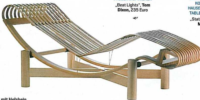
Liegen lernen DIE ALS LE-CORBUSIER-LIEGE BEKANNT GEWORDENE „LC4“ HIER ALS EIN OUTDOOR-PENDANT AUS BAMBUS, TEAK UND BUCHE „Tokyo“, Cassina, Preis auf Anfrage / Kaufinfo ab S. 230 /